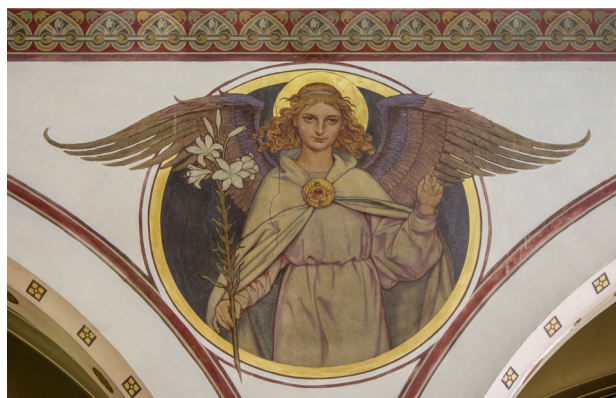
Boven: Bas-reliëf of de deur van het tabernakel met Christus weergegeven als Goede Herder. Onder: fries van de H. Gabriël.